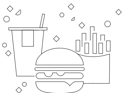
TABELA ALERGENÓW I WARTOŚCI ODŻYWCZYCH