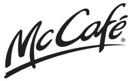
TABELA WARTOŚCI ODŻYWCZYCH McCAFÉ®